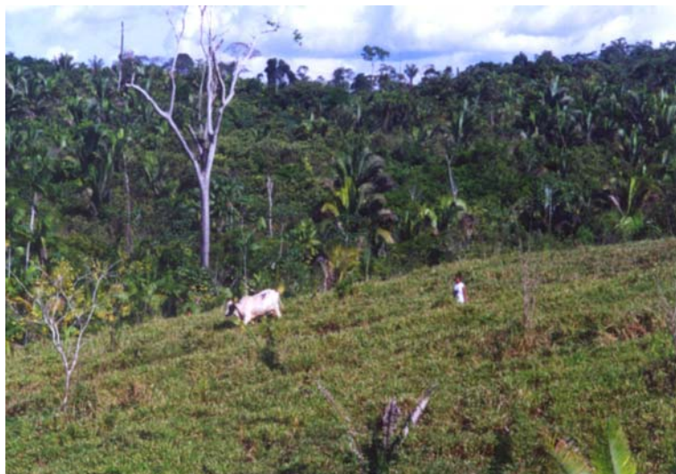
Figure 1-8 : Pâturages cultivés ( Brachiaria brizantha ) dans les exploitations laitières familiales en Amazonie brésilienne