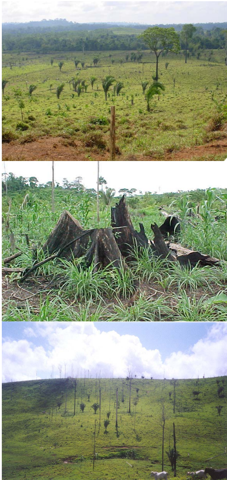
Figure 1-5 : Les pâturages en Amazonie brésilienne

possédant pas (Wood et al. , 2001). Le rôle du pâturage comme façon de marquer l'appropriation du sol est une explication peu satisfaisante pour l'agriculture familiale puisque les familles de la colonisation officielle gèrent l'implantation de pâturage de la même façon que les exploitations de la colonisation spontanée (Topall, 1995).