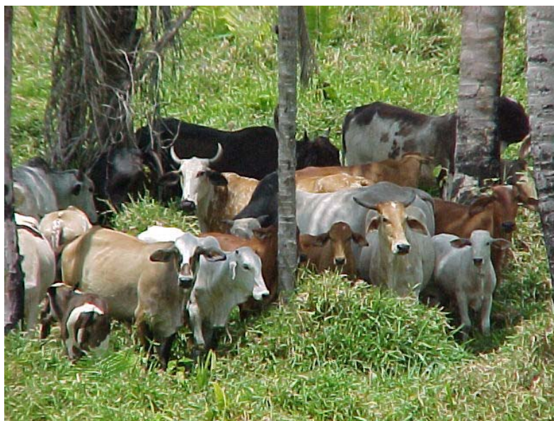
Figure 1-4 : Cheptels bovins de l'agriculture familiale sur les fronts pionniers amazoniens

L'expansion de l'élevage bovin ne peut, sans doute, pas être détachée de l'apparition d'une demande locale (Faminow et Vosti, 1997), conséquence du processus d'urbanisation en Amazonie (Becker, 1997). Elle apparaît en définitive très liée au contexte socio-économique, et surtout à la forte structuration de la filière aval, qui sécurise les débouchés et les prix, créant une situation favorable pour les petits éleveurs. Les systèmes de production des fazendas et de l'agriculture familiale entretiennent des relations très étroites car les veaux produits par ces derniers sont achetés par les grands propriétaires terriens (Poccard-Chapuis, 1997). Pour la seconde production de l'agriculture familiale, les vaches de réforme, il existe également une demande locale avec les abattoirs locaux et les bouchers. De ce fait, l'agriculture familiale est à la fois dans une situation sûre, mais de totale dépendance vis-à-vis de la grande production selon l'expression de Landais (1995). L'efficacité de la filière de commercialisation bovine en Amazonie constitue un avantage de l'élevage bovin par rapport aux autres productions agricoles (Poccard-Chapuis et al , 2001b). Le prix du bovin est également très peu soumis aux fluctuations inter et intra-annuelles, contrairement aux productions végétales (café, cacao, poivre) qui subissent d'importantes variations. Ainsi dans les années 1990, de nombreux paysans ont développé l'élevage suite à des contraintes avec les cultures pérennes