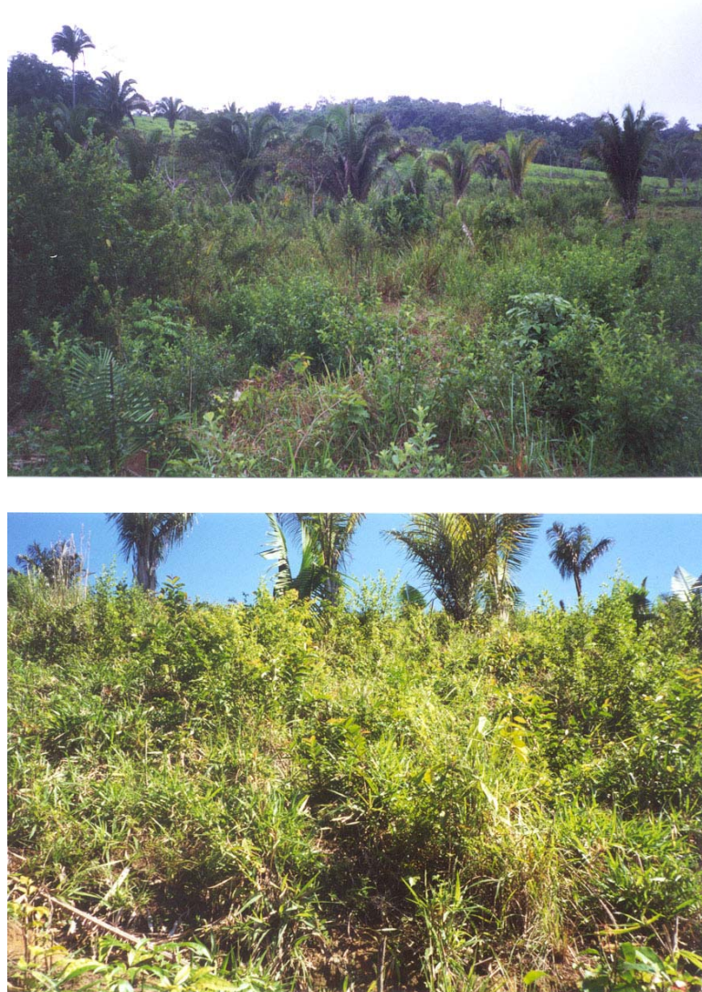
Figure 1-6 : Des pâturages dégradés

manière quasi irréversible, sauf si des moyens lourds, mécaniques ou chimiques, sont utilisés (Veiga, 1995 ; Duru, 1996). Ce type de dégradation semble pourtant peu commun en Amazonie (Dias Filho, 1998).