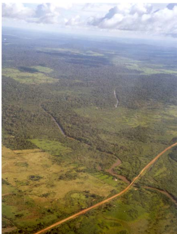
Figure 1-2 : La route Transamazonienne