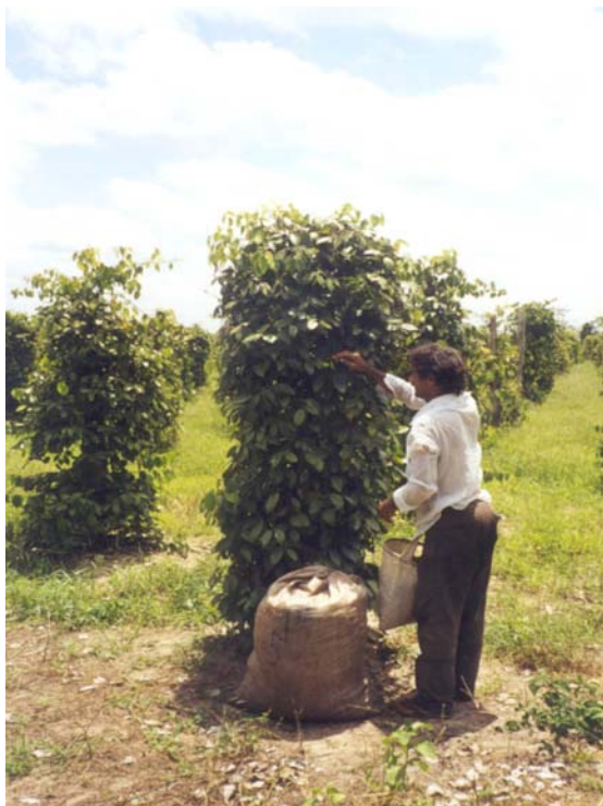
Figure 1-3 : Cultures de cacao et de poivre

◆ Le dégageant de l'INCRA pour l'installation des colons et la colonisation privée (1978 - 1988)