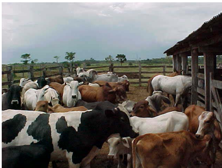
Figure 1-7 : Troupeaux laitiers dans les exploitations laitières familiales en Amazonie brésilienne

La production laitière est variable d'une vache à l'autre avec 300 à 1800 litres par an, et une majorité des vaches produisant environ 600 litres/an. La période de lactation dure de 5 à 9 mois, et est induite par le sevrage du veau. A Uruará, la production moyenne annuelle par exploitation est estimée à 17.500 litres (Tourrand et al. , 1998) avec 75 % des exploitations produisant moins de 20.000 litres par an. Le plus souvent, les troupeaux bovins de l'agriculture familiale sont en phase de croissance (Fichtl, 1999 ; Ferreira, 2001). Son