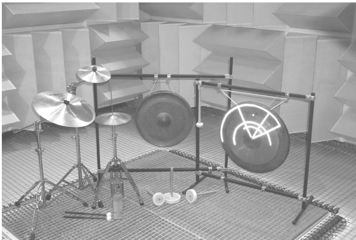
FIG. 1.1 – Quelques gongs et cymbales. De gauche à droite : cymbale “crash”, cymbale “splash”, cymbales charleston, gong viet-namiens (du type des “kempuls” indorésiens), tam-tam chinois.