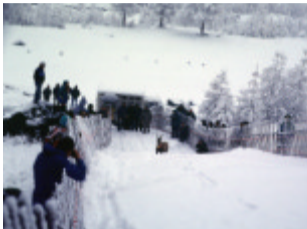
© Parc national de la Vanoise / Maurice Mollard

« Toute notre activité c'était de le faire repeupler en fait les Alpes, de le revoir sur nos sommets » (un naturaliste)