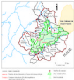
Carte 4 : Les espaces protégés des communes du Parc National de la Vanoise

longtemps favorables aux ongulés, lesquels descendent plus tardivement. En Haute-Tarentaise, c'est au contraire l'envers 367 qui se trouve « côté Parc ». L'impact du Parc sur la chasse au chamois diffère ainsi d'une vallée à l'autre, en fonction de l'orientation du versant « côté Parc ». L'orientation n'étant pas uniforme sur un même versant et les déplacements des chamois n'étant pas mécaniques, il s'agit là d'une généralisation. Il n'en reste pas moins que les relations entre les chasseurs de chamois et le Parc dépendent aussi de la configuration des lieux, et du comportement des animaux.